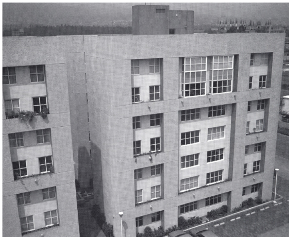
Vistas exteriores del conjunto