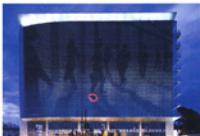
Corporativo Las Flores