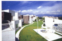
Lomas Country Club