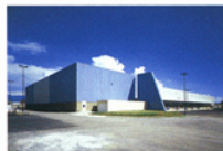
Cedros Oriente Business Park