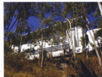
Salón de Usos Múltiples Tarbut