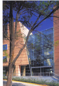
Bristol Myers Squibb