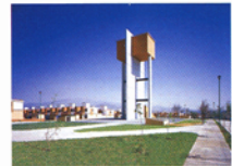
Paseos de Itzatlil