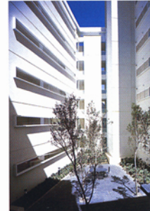
Scala Residencial