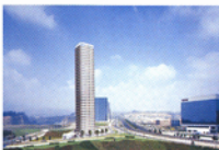
Panorama Santa Fe