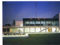
Centro de Comercio Tlalpan