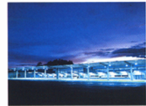
Terminal de Auto-transporte Zólocuan