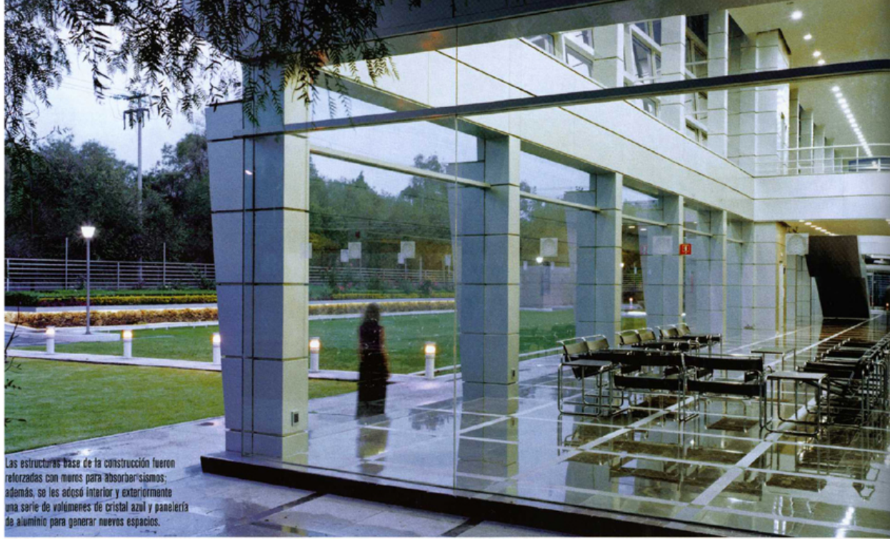
Las estructuras base de la construcción fueron reforzadas con muros para absorber sismos; además, se les adosó interior y exteriormente una serie de volúmenes de cristal azul y panelería de aluminio para generar nuevos espacios.