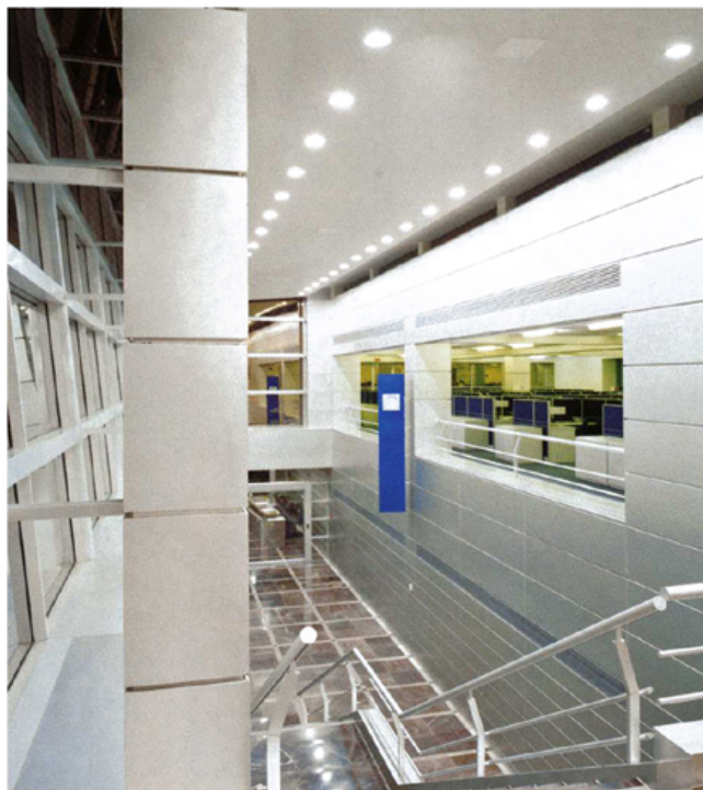
La combinación de colores neutros claros e iluminación blanca da como resultado un ambiente brillante. Éste expresa el espíritu tecnológico con el que se concibió el proyecto.