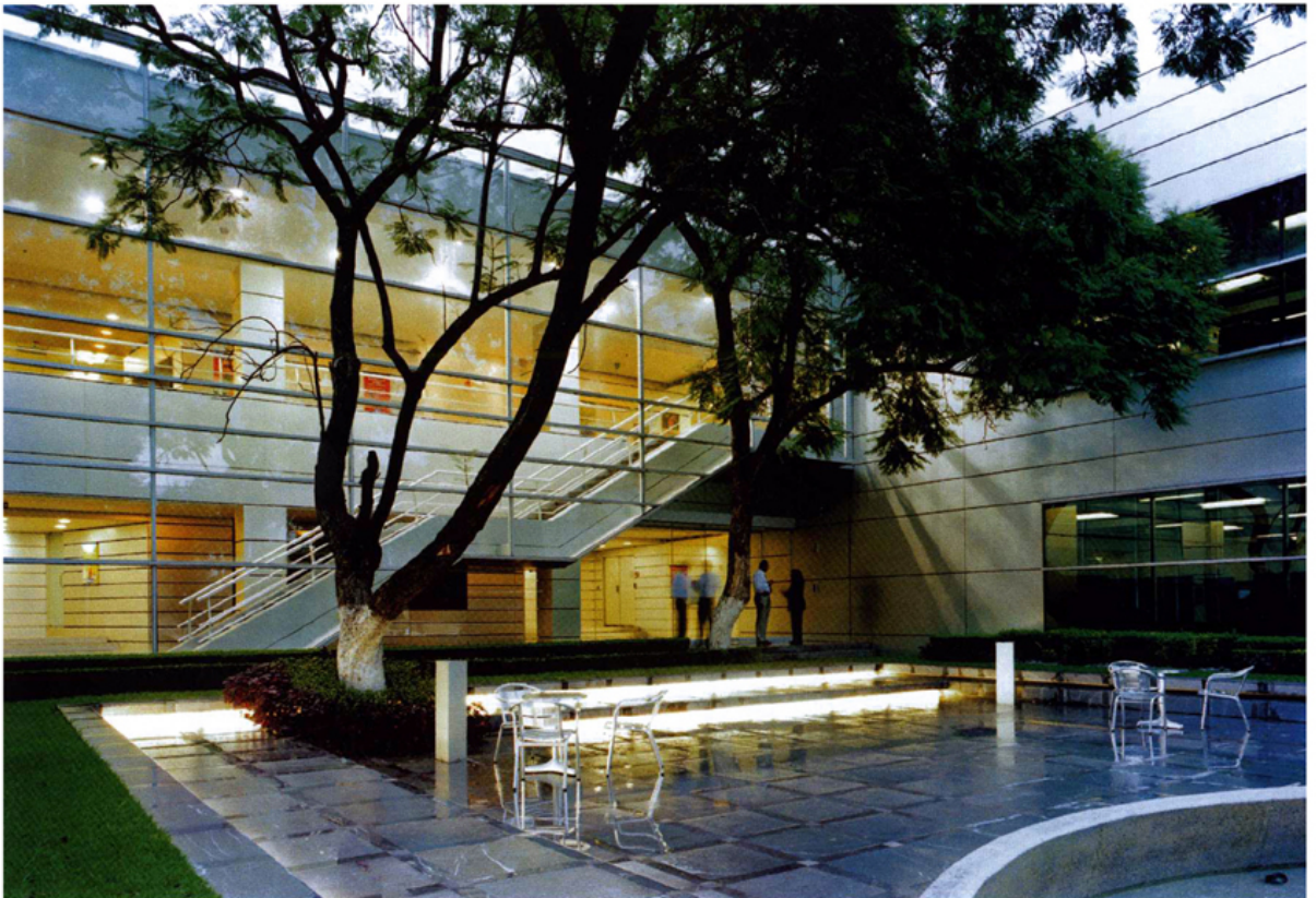
Los ventanales al exterior y las ventanas interiores de los despachos logran unir al centro de cómputo con su entorno y crean la percepción de espacios más amplios y libres. Las oficinas se complementan con áreas exteriores con bancas y una buena iluminación nocturna.